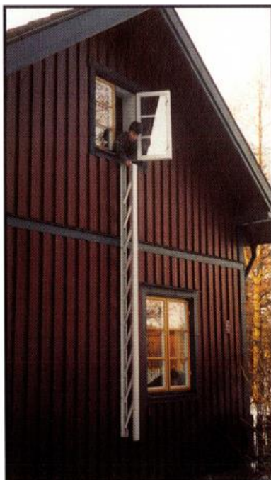
2. Stegen faller ut av sig själv