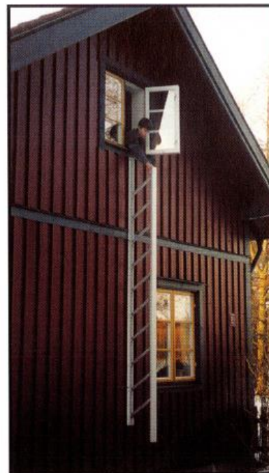
3. Stegen är klar att användas