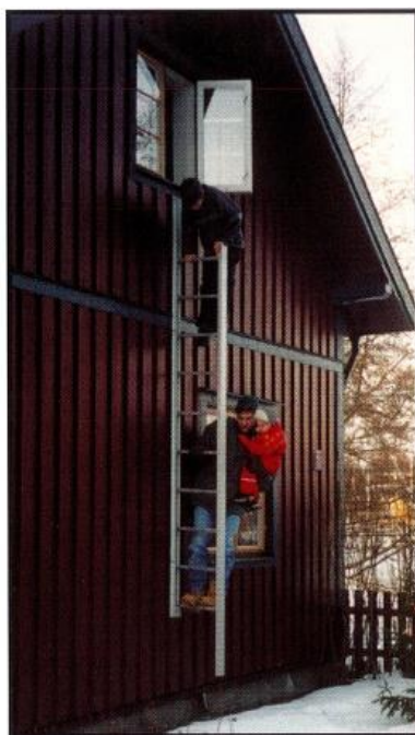
5. Klättra hela vägen ned på samma sida om stegen och håll stadigt i stegpinnarna eller den yttre profilen. Hela denna operation tar endast några få sekunder.