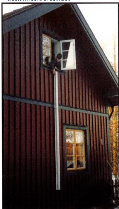
1. Öppna fönstret och dra ut sprinten som låser stegen