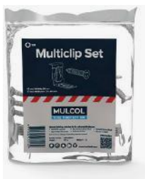
Multiclip Set 20 st. Multiclip, 30 mm 20 st. Multiscrews 7,5 x 40 mm Artikelnummer 802060001