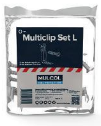
Multiclip Set L 20 st. Multiclip L, 60 mm 20 st. Multiscrew 7,5 x 40 mm Artikelnummer 802060002