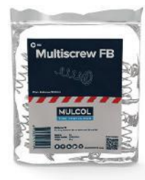
Multiscrew FB 20 st. Multiscrews FB, 40 mm för montage av eldfasta brädor Artikelnummer 802060005